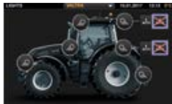
Leichte Einstellung der Arbeitsbeleuchtung über das Terminal oder mit Hilfe der Folientaster in der Armlehne.