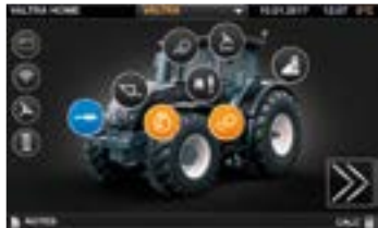
Übersichtliche und realitätsorientierte Benutzeroberfläche und Menüstruktur.

Valtra SmartTouch ist ein Meileinstein in der Benutzerfreundlichkeit. Es ist intuitiver als Ihr Smartphone. Mit nur zwei Tipp- oder Wischbewegungen können Sie alle Einstellungen erreichen und ändern. Die gesamte Technologie ist integriert: Spurführung, ISOBUS, Kamera, automatische Teilbreitenschaltung, variable Ausbringmengensteuerung und TaskDoc.