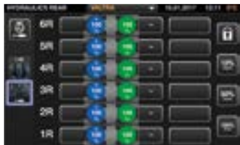
Steuerung der Hydraulik über jedes Bedienelement, auch die Hydraulikventile (vorn und hinten), Hubwerke (Front und Heck) oder der Frontlader.