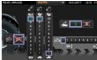
Intuitives Einstellen mit großen Bedienelementen und leicht verständlichen Funktionen.