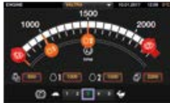
Logisch aufgebaute Einstellmenüs. Veränderung durch Verschieben der Cursor. Automatische Speicherung.